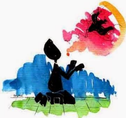
Invocación al Espíritu